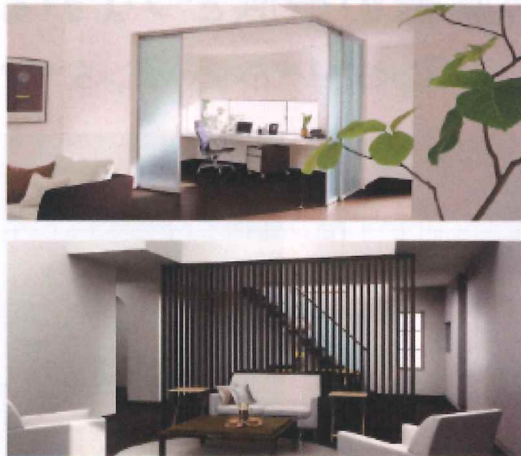
家族の気配をさりげなく伝える スタイリッシュな間仕切り

AUTUMN 食欲の秋、読書の秋、スポーツの秋...。それぞれの趣味を楽しむ空間づくり。