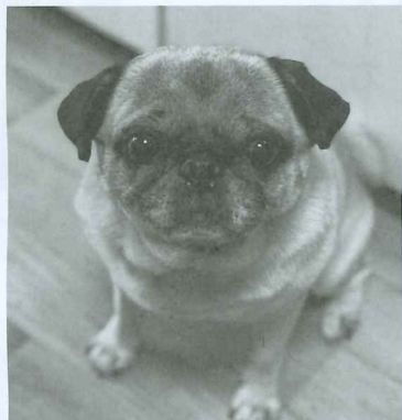
メロンちゃん 種類:パグ