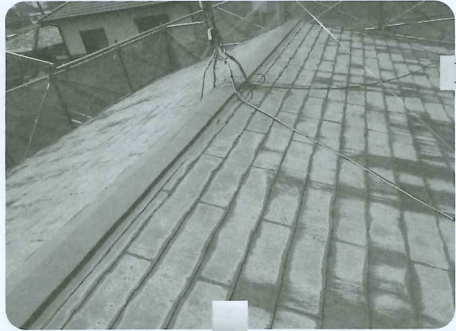
Before 既存瓦は そのまま

施工方法は、既存の化粧スレ ート屋根材を剥がさずに上から 葺き増しを可能にしたリフォー ム工法です。 材質はガラス繊維強化ファイ バーの屋根材です。軽量で柔軟