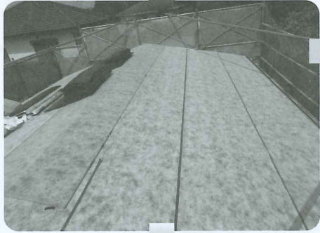
施工中 防水シート張り