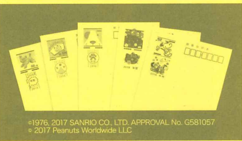
©1976, 2017 SANRIO CO., LTD. APPROVAL No. G581057 © 2017 Peanuts Worldwide LLC

倉田では年賀はがきを販売しています。来年の干支にちなんで「スヌーピー年賀」が人気です。各種取り揃えておりますので、1枚からでもお気軽にご購入ください。