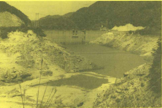
▲水位が著しく低下した南畑ダム(福岡県那珂川町)