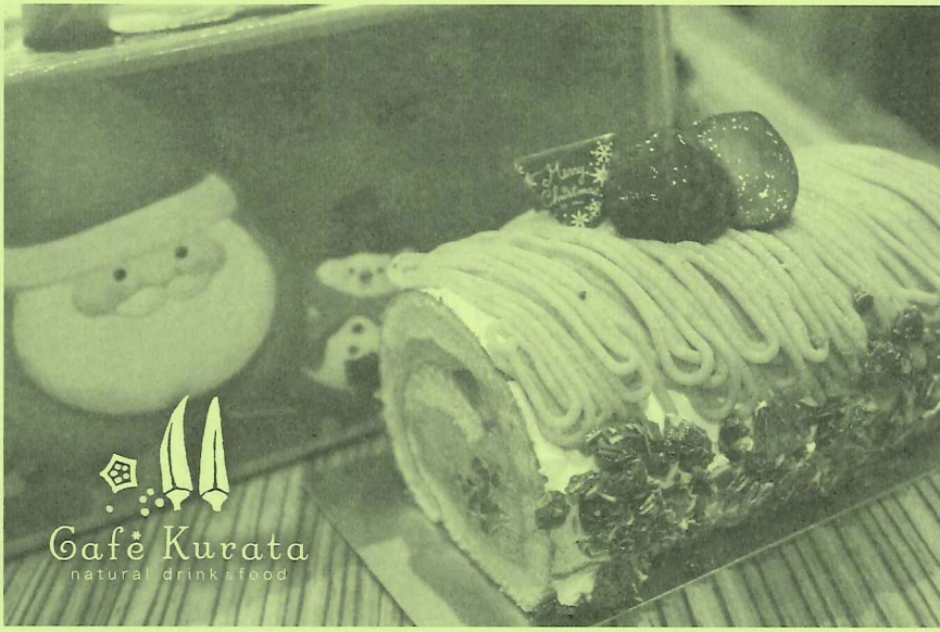
Gafe Kurata natural drink & food

粕屋町で50年 運気の良い会社です。 株式会社 倉田 TEL 092-938-2708 FAX 092-939-1715 粕屋町大字長者原382-47 URL http://k-kurata.com ◆住宅リフォーム介護福祉事業 リフレッシュ増改築 上下水道工事 介護福祉用品、貸与・販売業 水道施設(指定業者) 水処理・浄化槽工事 産業廃棄物収集運搬業 ◆エネルギー事業部 LPガス販売 ガス配管工事 灯油・燃料電池・太陽光発電 ◆タウンショップ 切手印紙 住設器具・機器販売 健康・環境(EM)商品販売、他